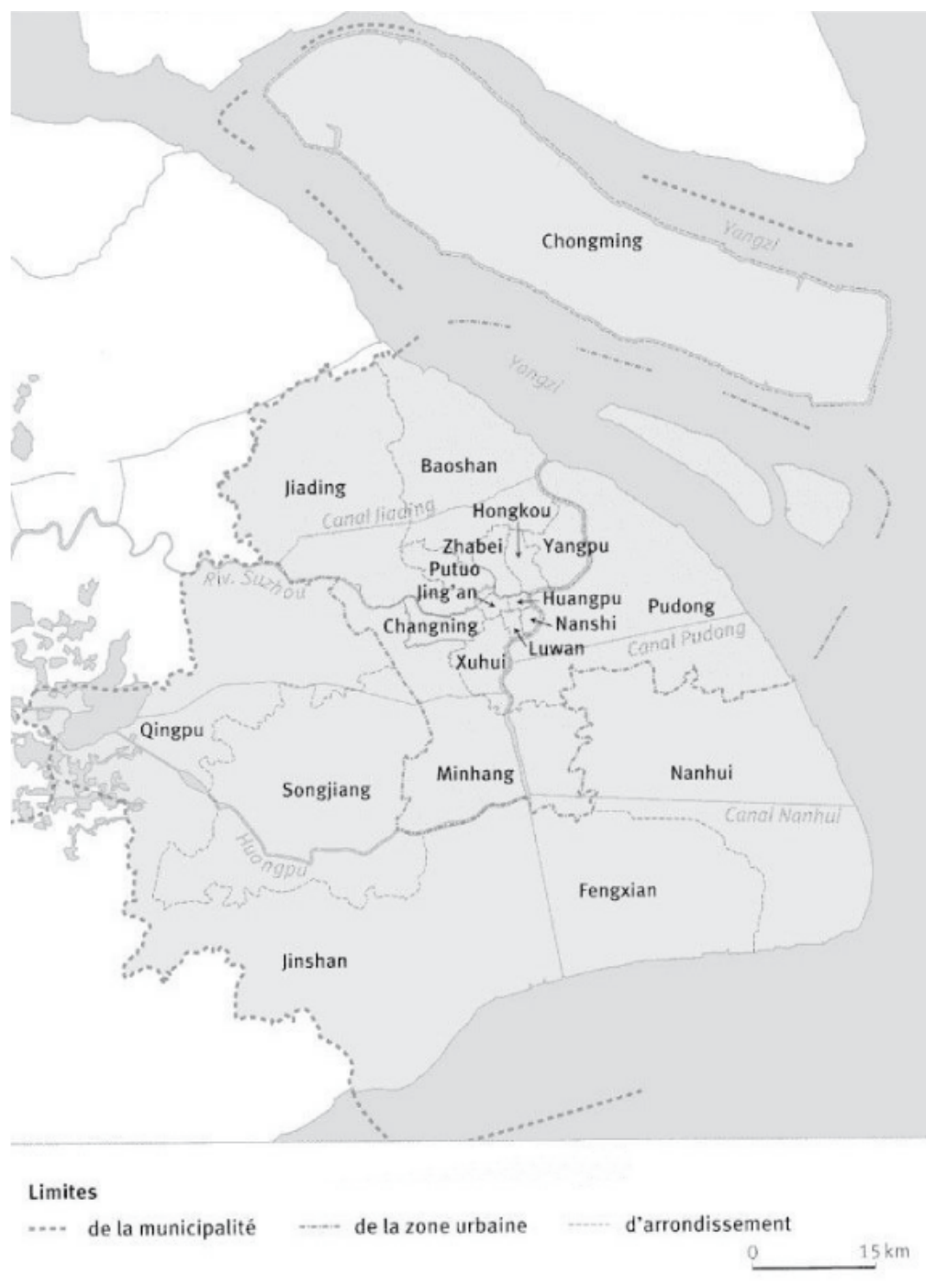
Carte 2 : Les limites de Shanghai